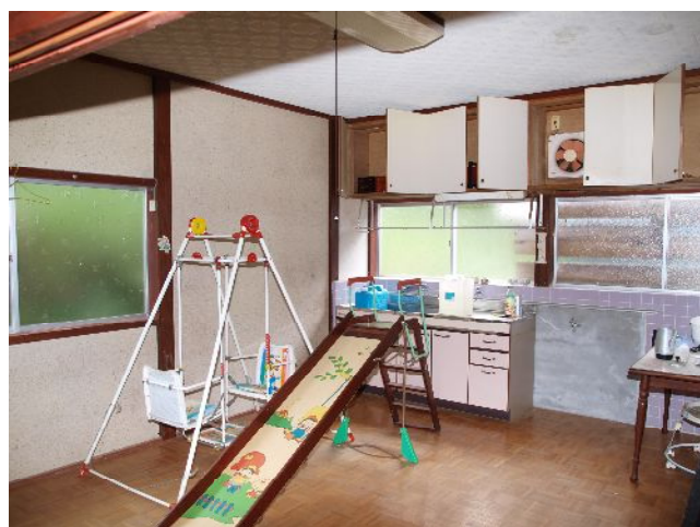
2階の部屋からは海が見えます