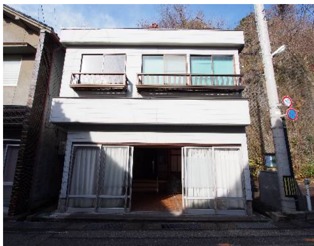
港町の小木に立地。