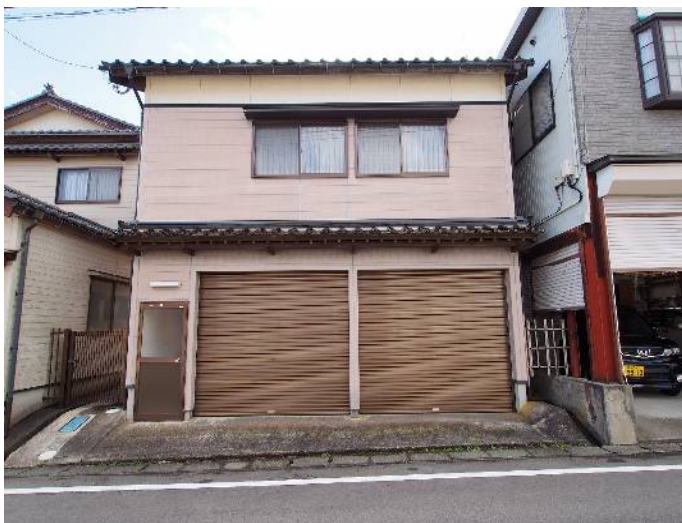
崎山3丁目の住宅街に立地