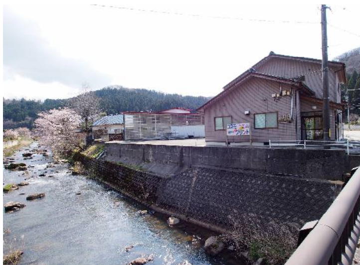
笹川の上町川沿いに立地