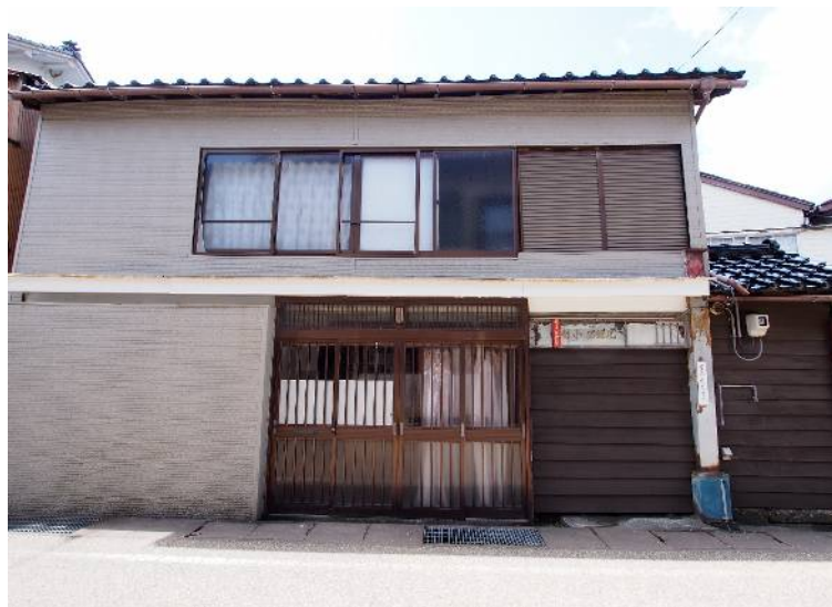
宇出津の川沿いに立地