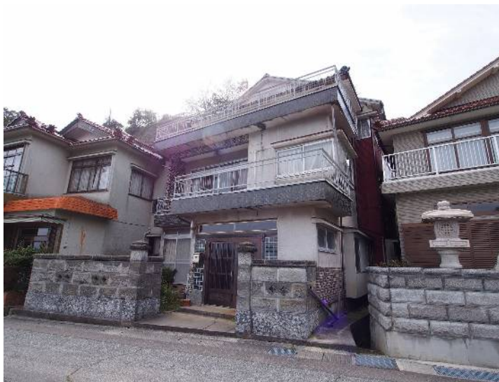
港町 姫の湾沿いの3階建て住宅