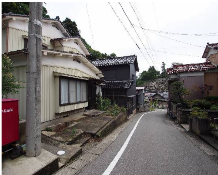
小木地区の高台に立地