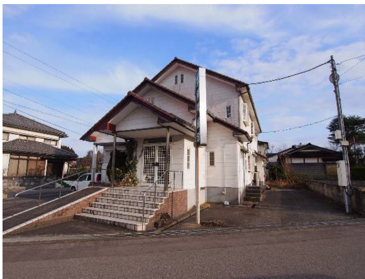
港町の鵜川地区に立地