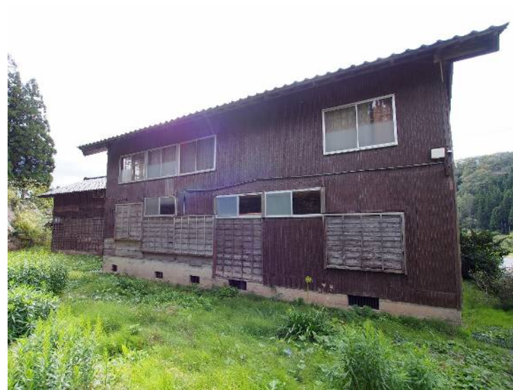
大箱地区に立地。裏側では畑が可能です